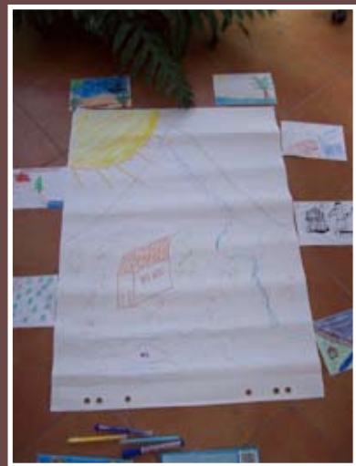
Trening za Odbor mladih

Odbor mladih djeluje od samog početka projekta "Za kvalitetno udomiteljstvo djece" s ciljem zastupanja mladih u području razvoja kvalitetne udomiteljske skrbi za djecu/mlade te općenito skrbi za djecu/mlade izvan vlastite obitelji. Odboru mladih se pridružilo 5 novih članova, a trenutno ga sačinjava 9 mladih iz različitih dijelova Hrvatske.